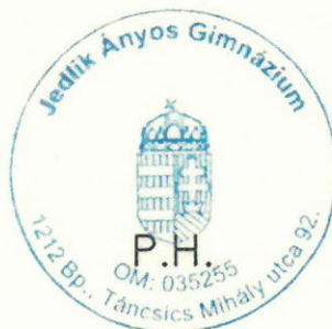
Bese Benő intézményvezető